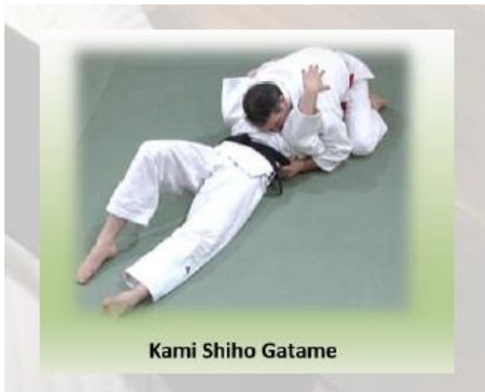
Kami Shiho Gatame